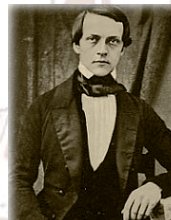
Hermann von Helmholtz